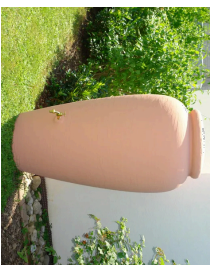
CUVE DE RÉUTILISATION DE 384 LITRES MINIMUM